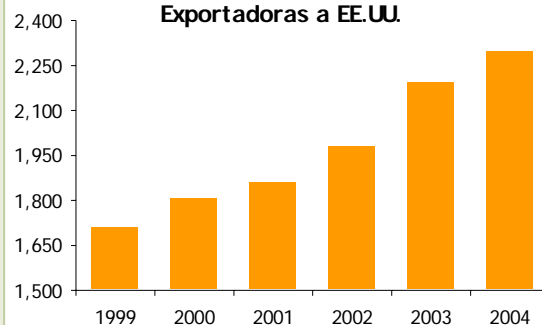
Perú: Número de Empresas Exportadoras a EE.UU.

El 10 de mayo, representantes del Poder Ejecutivo de Estados Unidos anunciaron que el Gobierno y el Congreso habían alcanzado un acuerdo en cuestiones laborales y en la visión de comercio internacional del país, lo que